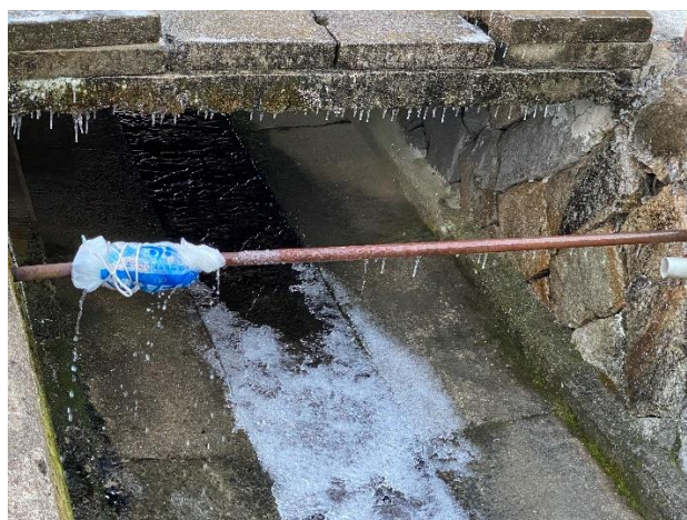
用水路を渡す露出給水管