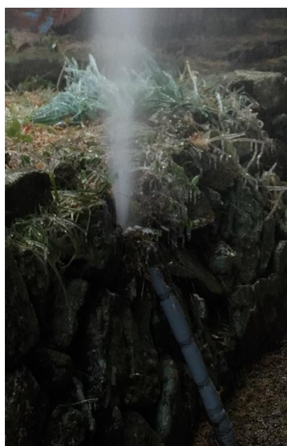
石垣を沿って配管された露出給水管